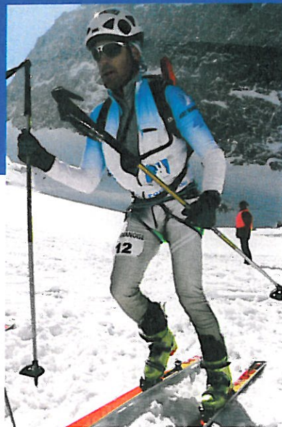
▲ En compétition (La TransVanoise 2008, à Pralognan dans les Alpes), les chaussures sont ultra-légères (ici des Scarpa F1, le modèle le plus répandu), avec un changement de position assuré par le même levier que le serrage de la tige.

Ce sont des chaussures lourdes, de 1,6 kg à plus de 2 kg par pied, avec quatre boucles, comme la Scarpa Skokum. Directement inspirées des chaussures de ski alpin, avec un flex qui peut atteindre les 110, elles s'en différencient par une semelle Vibram et un certain débattement de la tige en position montée. Certaines, comme les Black Diamond Factor ou Method, les Dynafit Titan ou Zeus, permettent de changer la semelle, d'un modèle rando à inserts Dynafit, à un modèle piste, lisse, adapté aux fixations de ski alpin (qui ne sont pas prévues pour les semelles crantées des chaussures de rando) : un bon choix