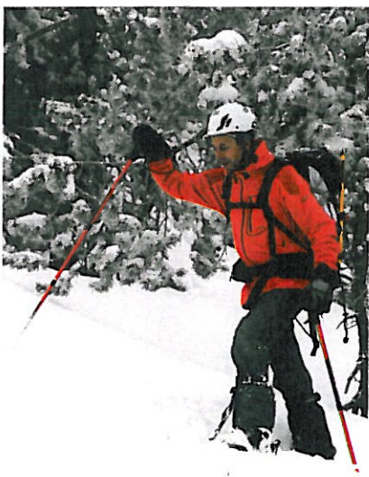
▲ À la montée (ici au Pla Guilhem, près du Canigou), une bonne chaussure de ski doit être confortable et autoriser un bon débattement de la tige.

Cette avancée technique a poussé Scarpa et Dynafit (Scarpa F1 Carbon et Dy.N.A) à sortir eux aussi des modèles où seule