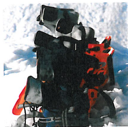
▲ Les chaussons classiques (au premier plan) séchent plus vite que les thermoformés !

Au cours des années 90, le marché se diversifia avec, d'une part, l'apparition de modèles souples et ultralégers destinés à la compétition, mais qui rencontreront aussi le succès auprès d'un large public (comme les TLT de Dynafit), et d'autre part des chaussures