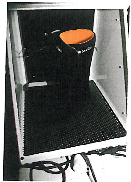
▲ Un chausson thermoformable dans le four du magasin Le Yéti à Montpellier. Une fois chauffé à environ 100°C, on enfle le chausson ramolli et on l'insère dans la coque. Laissez refroidir un quart d'heure, et le chausson sera parfaitement moulé au pied et à la coque des chaussures !

Les semelles intérieures fournies avec les chaussures de ski sont souvent très basiques. On pourra les remplacer avantageusement par des semelles thermoformées en magasin (Conformable), voire des semelles orthopédiques réalisées par un spécialiste (et en partie remboursées par la Sécurité Sociale avec une prescription médicale !), qui caleront parfaitement le pied dans la chaussure. Par ailleurs, si après tous ces thermoformages et ajustements, votre pied n'est pas bien tenu ou qu'il y a des douleurs, des spécialistes du "bootfitting" (surtout présents dans les grandes stations de ski) peuvent caler encore mieux le chausson dans la coque. Cela peut être réalisé avec des cales en mousse dure collées à l'intérieur de la coque ou, plus complexe, en déformant la coque à chaud (souvent au niveau des malléoles) pour s'adapter à la morphologie du pied.