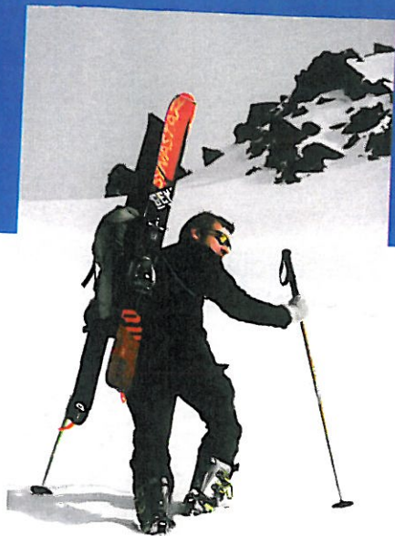
▲ La panoplie du freerandonneur moderne : chaussures lourdes (Black Diamond Method) dotées d'un excellent maintien et fats avec des fixations Low Tech (ici des Dynastar Legend Prorider, pas moins !).