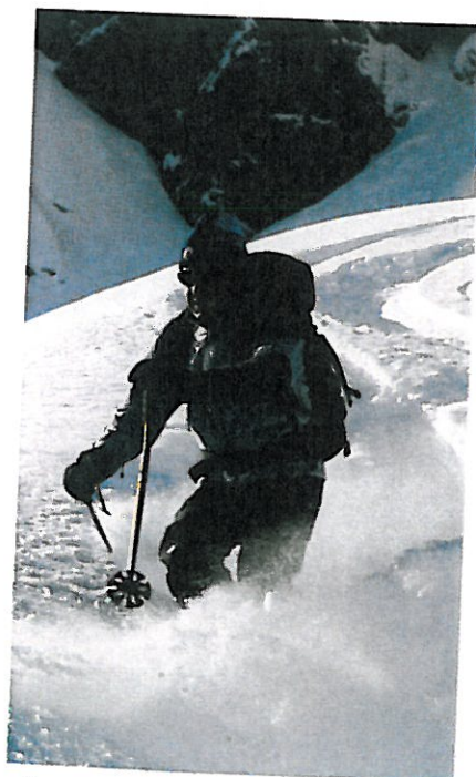
▲ À la descente, on apprécie le maintien des chaussures plus lourdes, surtout avec des skis larges.